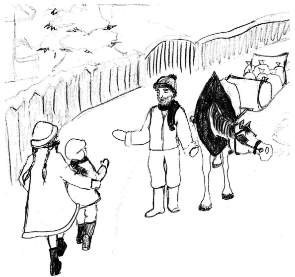
Zeichnungen: Anuschka Hau

„Liebe ist ja nur ein Märchen ...“ klang es aus dem Radio.